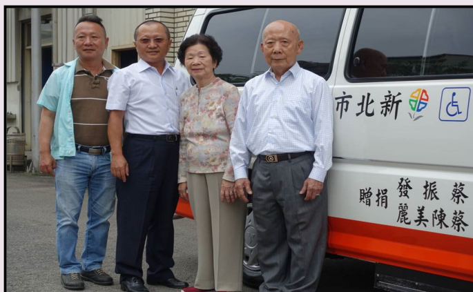
2019 年捐贈『新北市政府消防局災情勘查車』